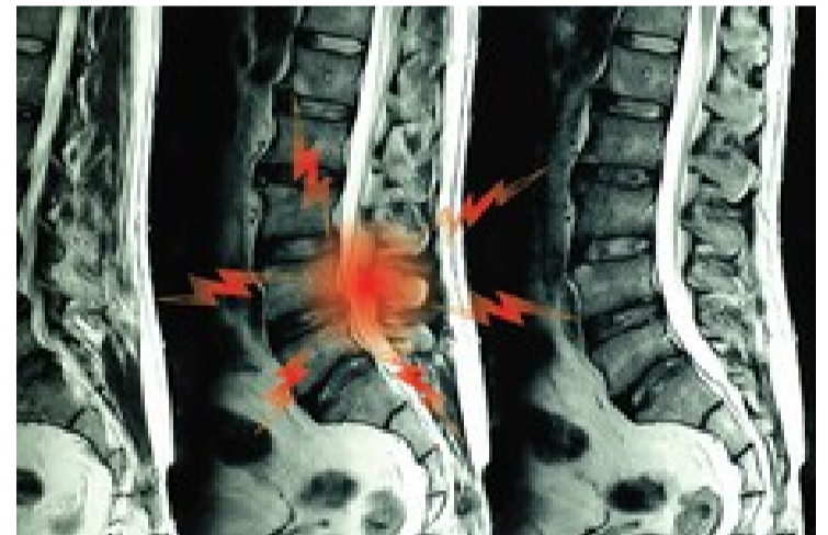
عمل کمر ممنوع! با این روش در خانه درمان شوید (مشاوره رایگان)