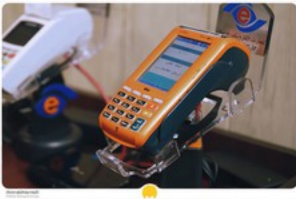
می دونی چقدر مالیات برای دستگاه کارتخوانت بریدن؟