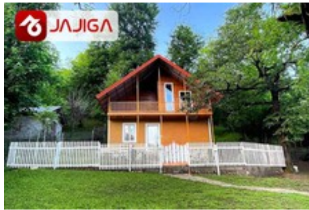
ویلاها و کلبه‌های کمتر دیده‌شده | رزرو آنلاین در جاجیگا