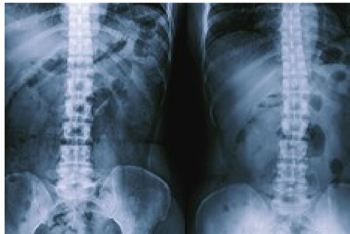
درمان فوری کمر درد و دیسک در کمتر از ۷ روز! «بدون جراحی»