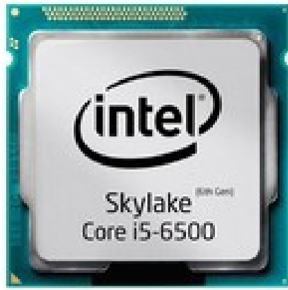
Intel Core i5-6500 CPU Tray | ۲,۰۰۰,۰۰۰ تومان (11% تخفیف)