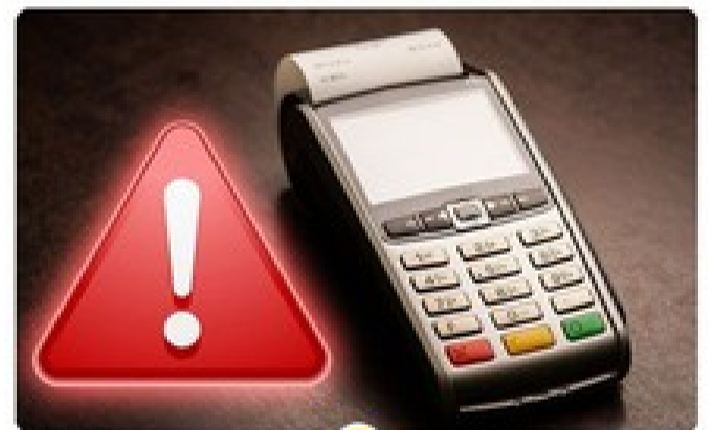
میدونی مالیات کارتخوانت چقدره؟ محاسبه تراکنش‌ها با محک