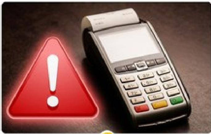
میدونی مالیات کارتخوانت چقدره؟ محاسبه تراکنش‌ها با محک