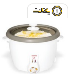
طعم دلچسب ته دیگ ایرانی را با پلوپزهای تایمردار مه پویا تجربه