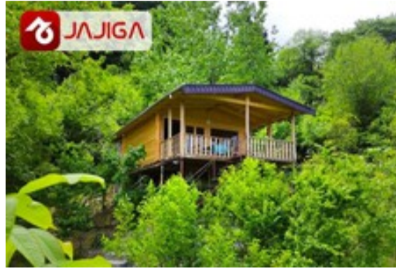
یه کلبه‌ی دنج وسط کوه‌های شمال | رزرو در جاجیگا