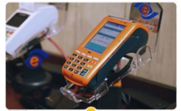
می دونی چقدر مالیات برای دستگاه کارتخوانت بریدن؟