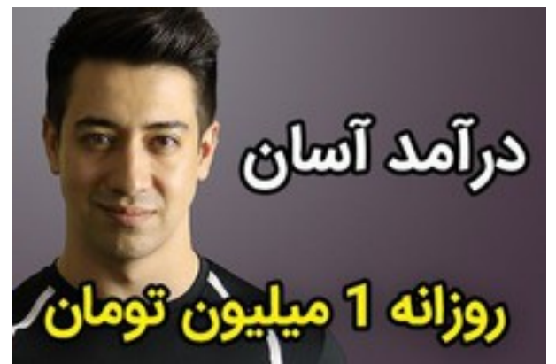
بدون سرمایه ساعتی 42 هزار تومان درآمد داشته باش!