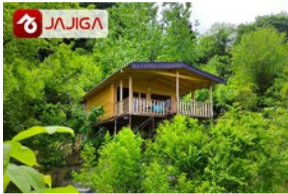
یه کلبه‌ی دنج وسط کوه‌های شمال | رزرو در جاجیگا