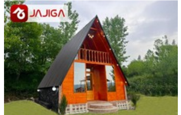
کلبه سوئیدی وسط جنگل‌های شمال! | رزرو در جاجیگا